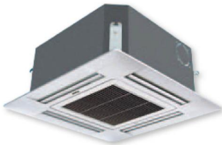
AB09CS1ERA AB12CS1ERA AB18CS1ERA